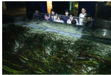
アマモの隙間に隠れて休む魚を観察