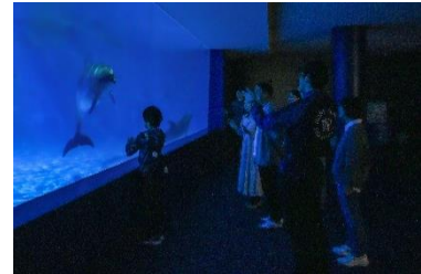
夜のドルフィンホール

【神戸須磨シーワールドホテル】 https://www.kobesuma-seaworld.jp/hotel/