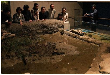
夜間に水位が上がる干潟水槽