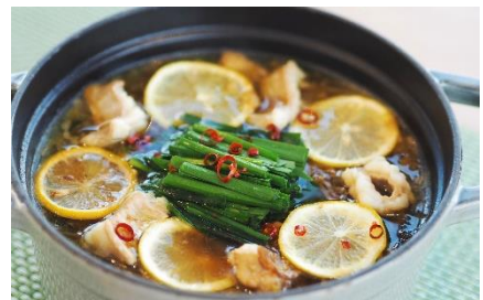
広島レモンもつ鍋