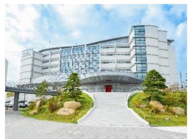
神戸須磨シーワールドホテル