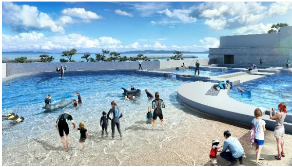
ドルフィンビーチ