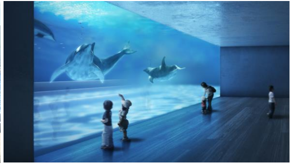
ドルフィンホール