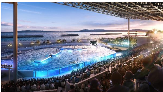
オルカスタジアム