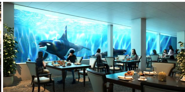
ブルーオーシャン オルカスタジアム