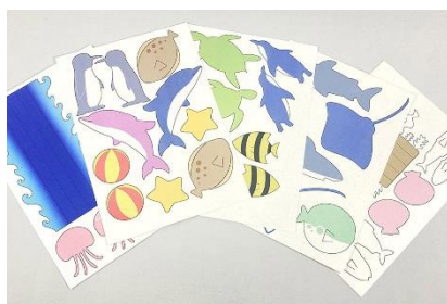
生きものの塗り絵（イメージ）