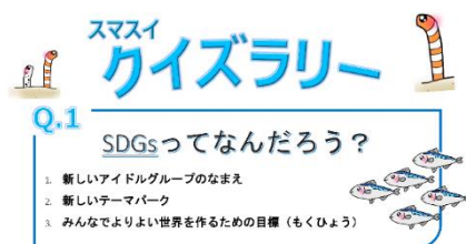
クイズラリー例題①