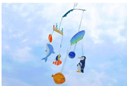
モビール（完成イメージ）