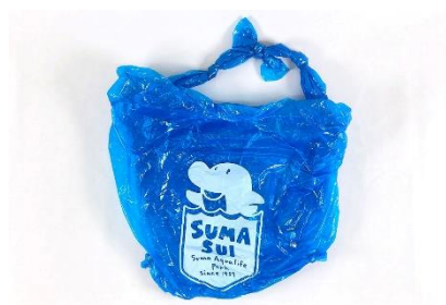
ポンチョのリメイクバッグ