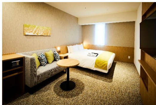
スーペリアダブルルーム

ご利用価格 : スーペリアダブルルーム 平日2名様1室ご利用時、1名様 4,500円 ~ ※税・サ込