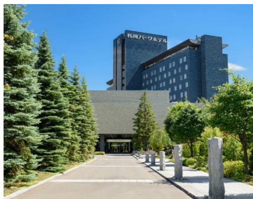
札幌パークホテル

コロナ禍でリラックスした時間を過ごすことや、移動制限によって旅行を楽しむことが難しい昨今、新型コロナウイルス感染症のワクチン接種促進と一日も早い日常への復興の一助にという思いも込めて、宿泊プランをご用意いたしました。