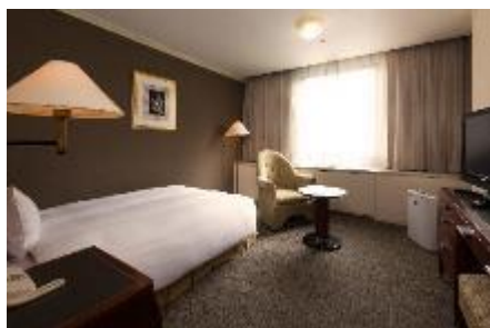
札幌グランドホテル スタンダードシングルルーム

札幌パークホテル(シングルルーム) ・3泊4日プラン 42,800円 ・2泊3日プラン 30,000円