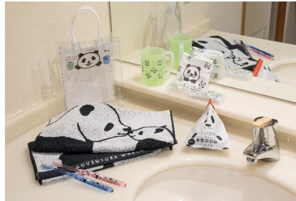
「お土産用アメニティグッズ」(イメージ)