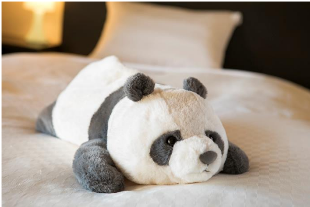
「お土産用パンダ」ベッドでお出迎え