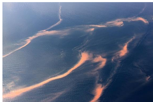
瀬戸内海に発生した赤潮