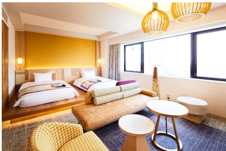
【ジュニアスイートルーム（47㎡）】

営業再開にあたり、お客様や従業員の安心・安全な環境をまもるため、「三密回避」「衛生管理」「従業員の健康管理」など、新型コロナウイルス感染症対策の基本方針に基づき、取り組んで参ります。尚、朝食を含む営業内容は当面の間、変更させていただきます。