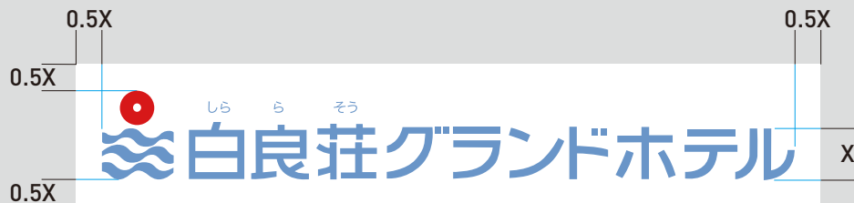
ブランドロゴ和文 縦型