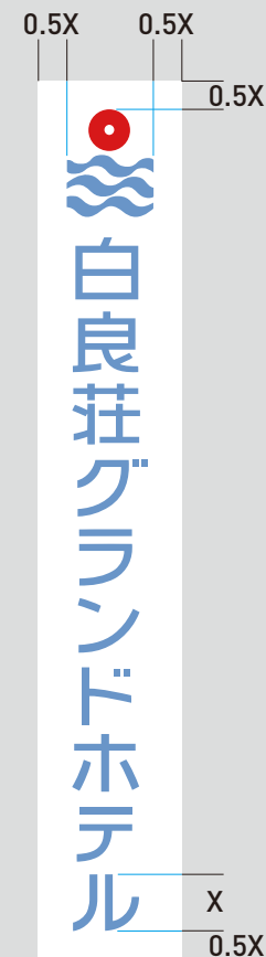
ブランドロゴ和文 縦型