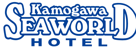
ブランドロゴ 単色バージョン