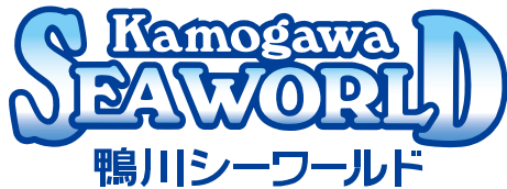
ブランドロゴ和文併記 グラデーションバージョン