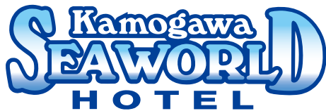
ブランドロゴ グラデーションバージョン