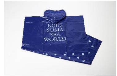
プラン特典 : ポンチョ

URL : https://www.kobesuma-seaworld.jp/guide/event/8663/