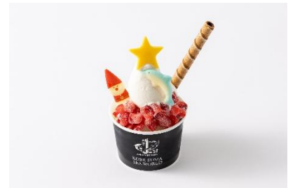
【12 月限定】イルカとサンタのソフトクリーム (800 円)