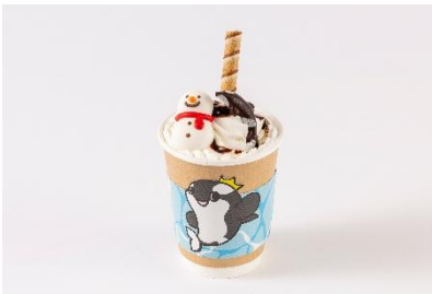
シャチと雪だるまのウインナーコーヒー (800 円)