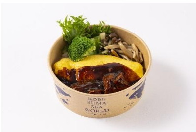
オムライス 神戸牛シチューソース (1,800 円)