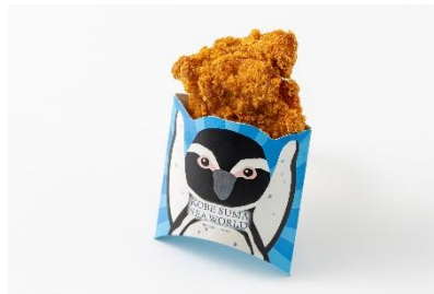
すまチキ (600 円)