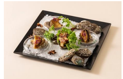
エゾアワビの中華風煮込み

北は日本海、南は瀬戸内海に面し、多彩で豊かな食文化が発達してきた兵庫県ならではの食材を使ったメニューをお楽しみいただける地産地消にこだわったフードコートです。