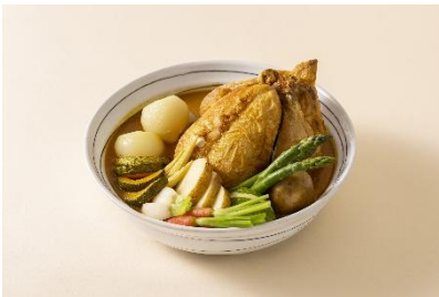
但馬どりの Grill スープカレー仕立て