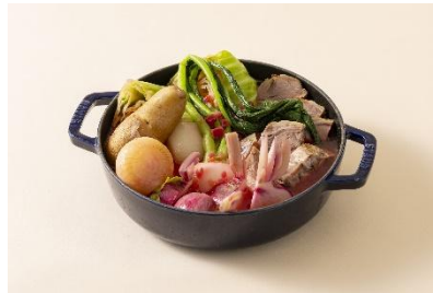
牛すね肉のボルシチ風