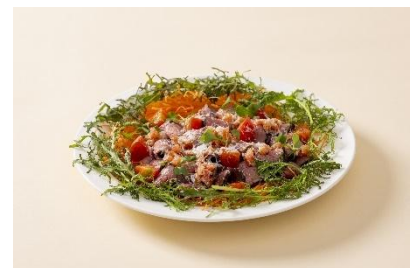
牛たたきパルメザンチーズと トマトヴィネグレット