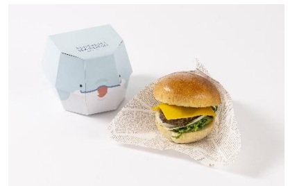
但馬どりの親子風てりたまバーガー (1,500 円)