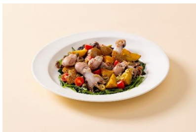
飯蛸とインカのめざめのケッパーソース