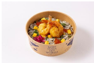
瀬戸内しらすと海老天の 2 色丼 (味噌汁付) (1,700 円)