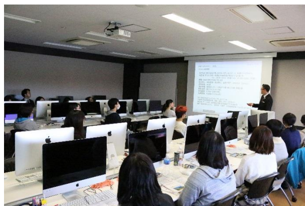
※2018年10月2日 専門学校の教室にてオリエンテーション

このプロジェクトは、ホテル開業 55 周年記念ロゴマーク制作という課題を、札幌放送芸術&ミュージック・ダンス専門学校の学生へ依頼することにより、学びの場を提供し、学校が進めている産学連携教育による人材育成「企業プロジェクト」にも協力する事で、記念すべき周年事業において重要な、地域への感謝を込めた社会貢献も果たせるとの考えからスタートいたしました。