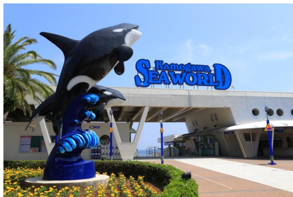
鴨川シーワールド