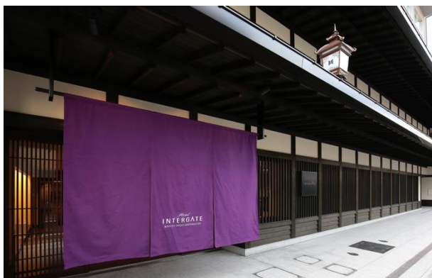
ホテルインターゲート京都 四条新町